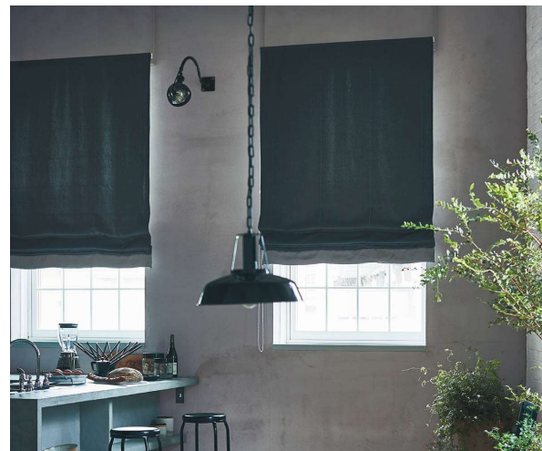
本体生地: FT6282 ボーダー生地(下部生地): FT6119