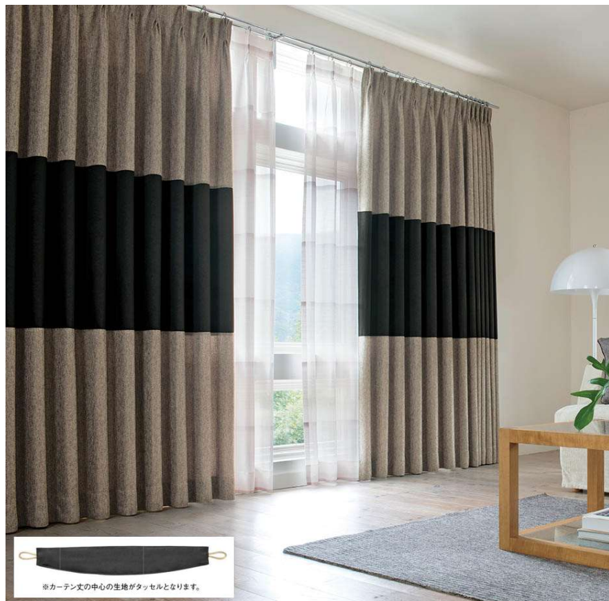
ベース生地(上・下生地): FT6272 ボーダー生地(中生地): FT6121

レザータッチの素材と天然ライクな素材を組合わせたヴィンテージスタイルのカーテンです。